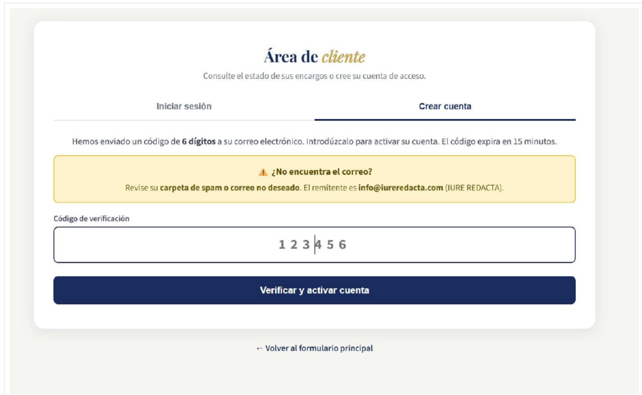
Pantalla de introducción del código de verificación de 6 dígitos.